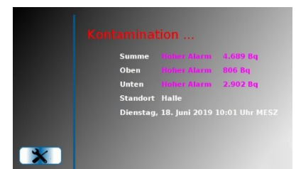
Menüoberflächen der Bediensoftware